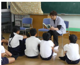
【読書ボランティアの様子】

期間中は毎朝、図書室に本を借りに来る子供たちの行列ができるなど、子供たちの読書に対する関心が高まってきたようです。