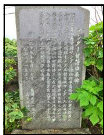
【サンダー甘藷由来碑】

学校の環境整備(校庭の草刈り・清掃等)をしていると実に多くの記念碑があることに気付きます。