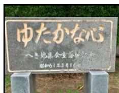
【へき地集会室落成記念碑】