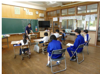
【授業を参観する中学生の様子】

今回の交流を通して、子供たちは年上の人と関わる喜びを感じ、中学生は“教えることの楽しさ”や“働くことの大変さ”を学ぶことができたようです。