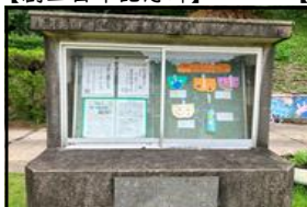
【平成4年度卒業記念碑】