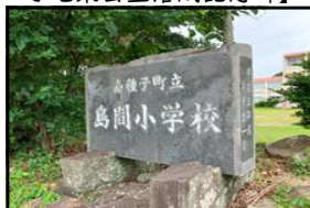
【平成3年度卒業記念碑】