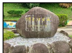
【新校舎落成記念碑】